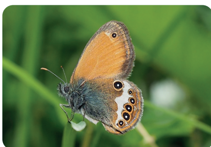
Weissbindiges Wiesenvögelchen Coenonympha arcania