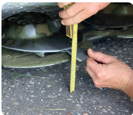
Einstellung der Mahdhöhe an einem Kreiselmähwerk