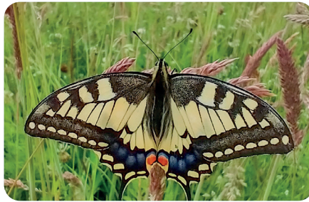
Schwalbenschwanz Papilio machaon