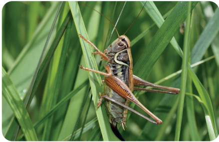
Roesels Beißschrecke Roeseliana roeselii