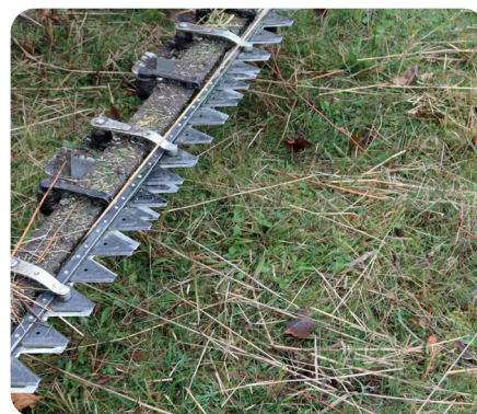
Messerbalken reduzieren Insekten-Verluste