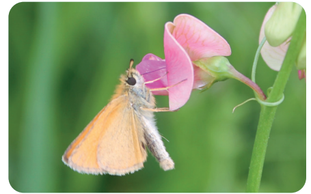
Schwarzkolbiger Braun-Dickkopffalter Thymelicus lineola