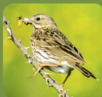
Feldlerche Alauda arvensis