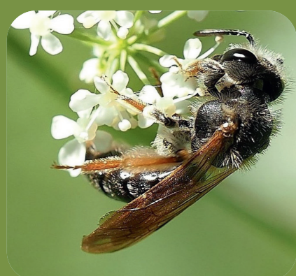
Goldbeinige Sandbiene Andrena chrysoceles