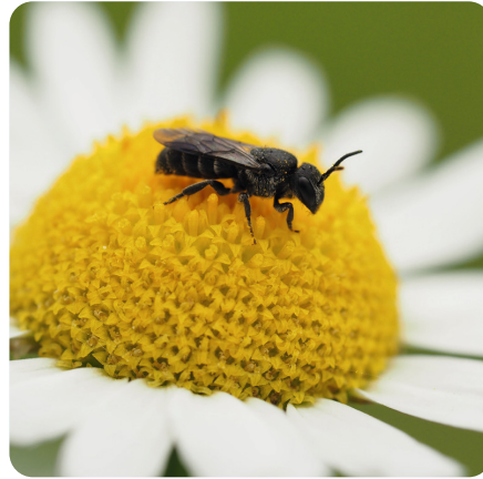
Düsterbiene Stelis breviscula

Findet sie keine hohlen Pflanzenstängel oder Hohlräume in totem Holz, nistet diese Wildbiene auch in Nisthilfen. Sie sammelt Pollen an verschiedenen Korbblütlern (Asteraceae).