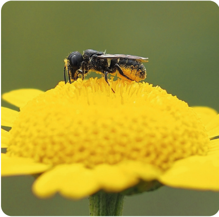
Gewöhnliche Löcherbiene Heriades truncorum

Beispiele von Wildbienen, die gerne in das neue Zuhause einziehen werden.