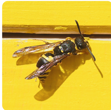
Faltenwespe Ancistrocerus nigricornis

Sie verschließt ihre Nester mit einer Mischung aus Lehm, Sand, Speichel und Blütennektar. Für mehr Stabilität werden noch zusätzlich kleine Steinchen eingearbeitet.