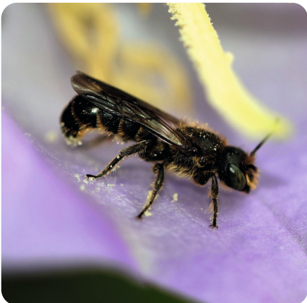
Glockenblumen- Scherenbiene Chelostoma rapunculi

Diese Wildbiene baut nicht selbst Nester, sondern legt ihre Eier in die Nester der Gewöhnlichen Löcherbiene ( Heriades truncorum ).