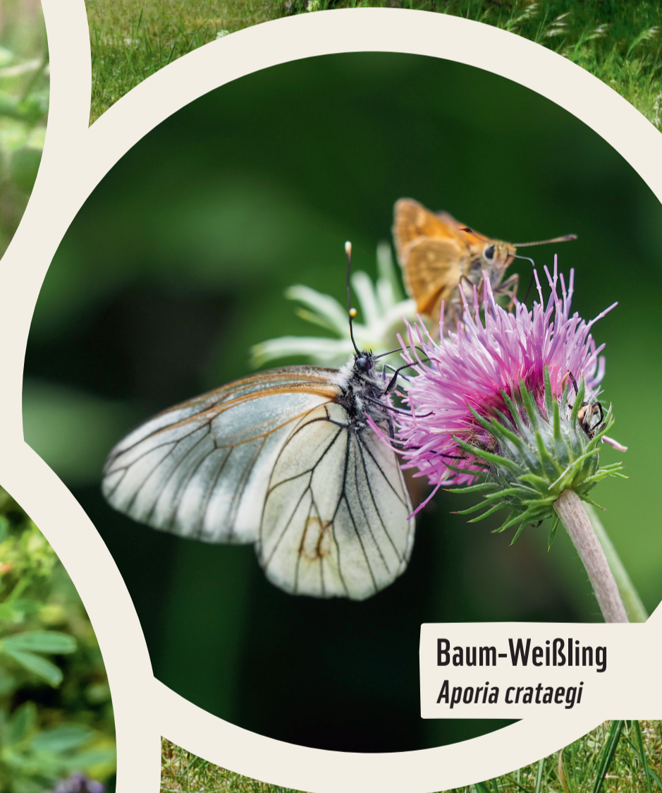
Baum-Weißling Aporia crataegi

Gestaltung: epqstudio.com