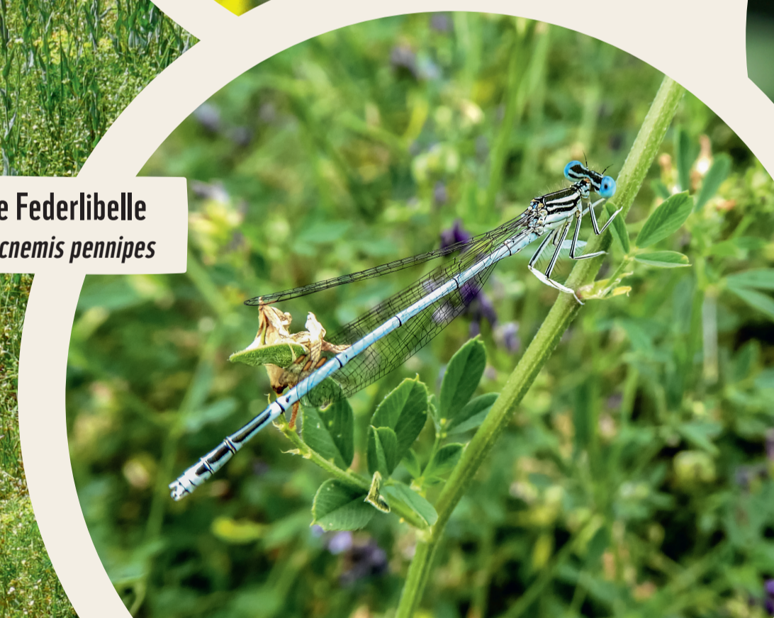
Blaue Federlibelle Platycnemis pennipes