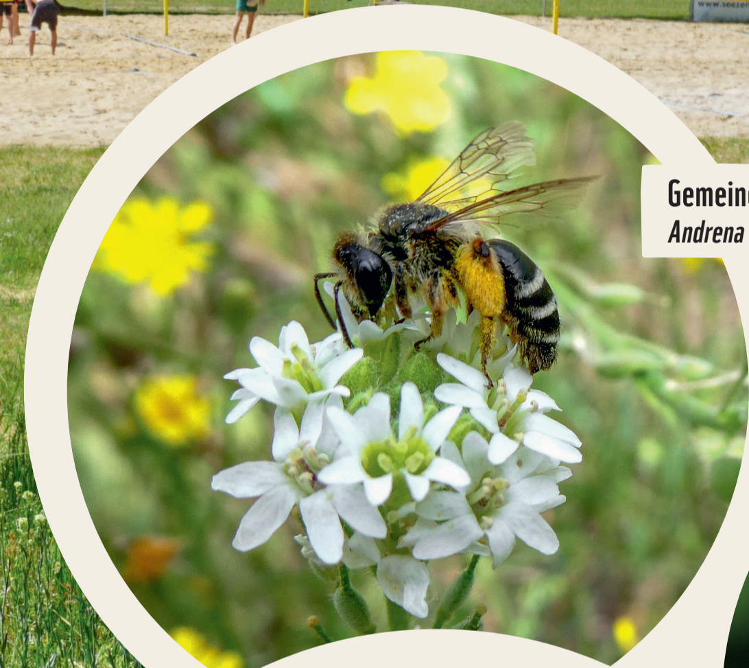
Gemeine Sandbiene Andrena flavipes

Weitere Infos finden Sie auf unserer Webseite brommi.org