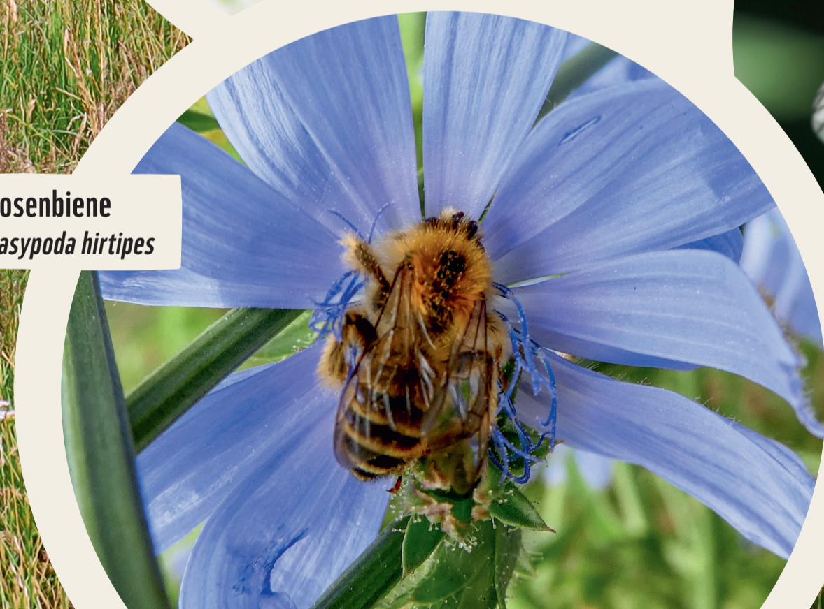
Hosenbiene Dasypoda hirtipes