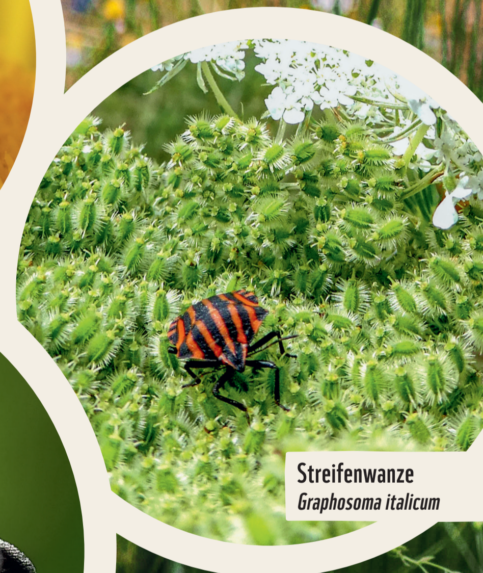
Streifenwanze Graphosoma italicum