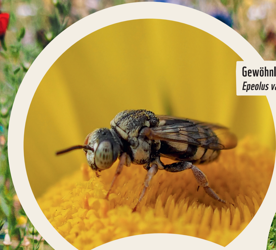
Gewöhnliche Filzbiene Epeolus variegatus

Weitere Infos finden Sie auf unserer Webseite brommi.org