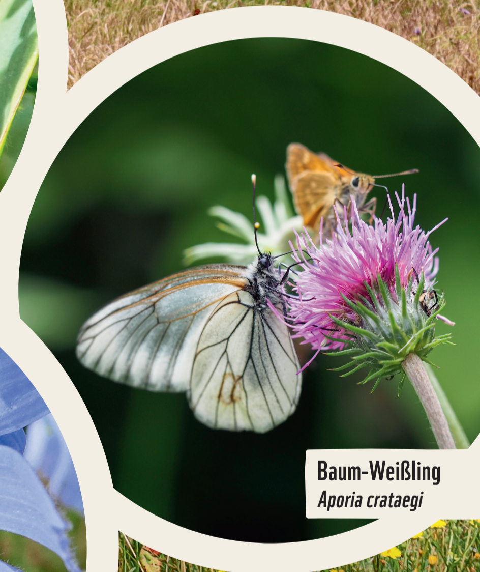
Baum-Weißling Aporia crataegi

Gestaltung: epqstudio.com