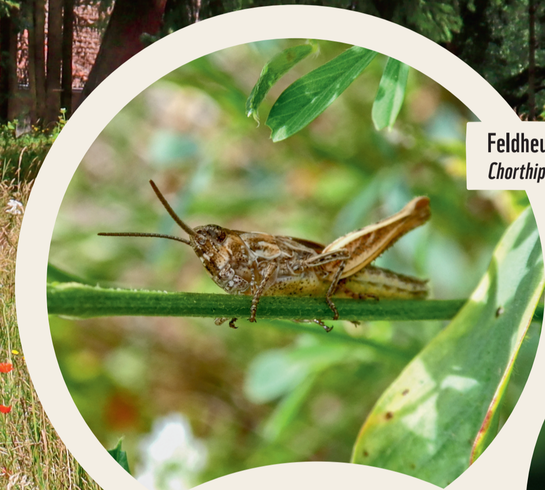
Feldheuschrecke Chorthippus sp.

Weitere Infos finden Sie auf unserer Webseite brommi.org