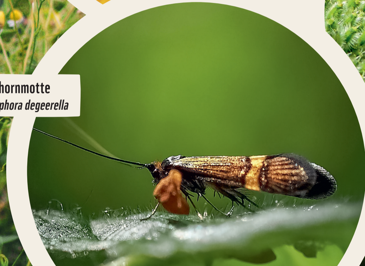
Langhornmotte Nemophora degeerella